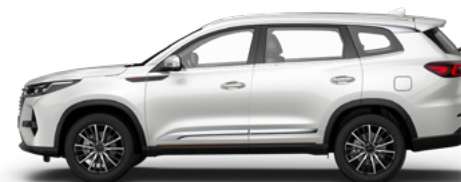
Иней — белый металлик