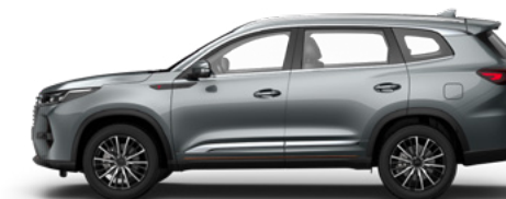
Магнат — серый металлик