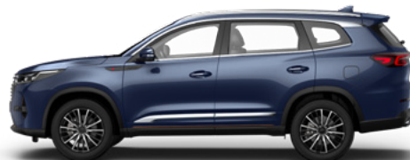
Компас — синий металлик