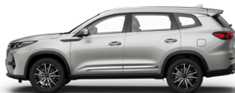
Роса — серебристый металлик