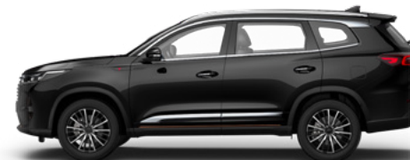
Лунное затмение — черный металлик